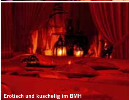
Erotisch und kuschelig im BMH

ze, auch für Wohnmobile, zur Verfügung. Die Bertreiberin I. Pruka ist sehr stolz, dass Events, wie die Große Sklavenauktion, Der 24h Knast, Excès de Roissy, PetPlayParty und andere, in der großen, angrenzenden Lagerhalle und dem 6.000 qm großen Außengelände stattfinden können.