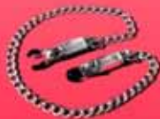
McHurt-Klavieren zum Schrauben, mit Kette 18,40 €

... und noch mehr gemeinsames Spielzeug!