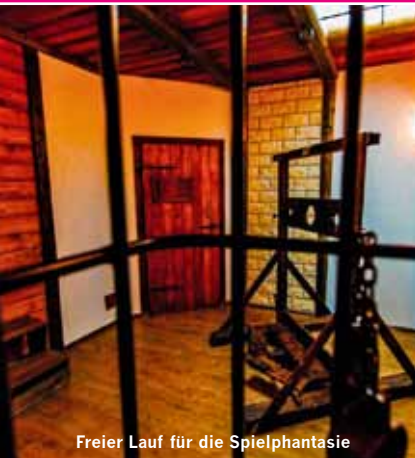
Freier Lauf für die Spielphantasie

einem neutralen Ort einzuladen als in einen SM-Club. Trotzdem ist das BMH in erster Linie ein Club, in dem alle Facetten der Erotik ausgelebt werden. Das BMH hat sich von festen Öffnungszeiten und Konzepten verabschiedet, um flexibler auf die Partywünsche der Gäste und Veranstalter eingehen zu können. Die Vielseitigkeit der Partys ist und bleibt das Ziel. Durch die außergewöhnliche Größe, im Obergeschoss sind 11 exklusive SM-Spielzimmer gelegen, es gibt einen großen Barbereich, und im Erdgeschoß sind sechs schön ausgestattete Räume, die zum erotischen Verweilen einladen und durch einen kleinen Barbereich ergänzt sind, hebt sich die Event-Location von vielen anderen Clubs deutlich ab. In den SM-Räumen findet man beispielsweise ein drehbares Kreuz, Sklavenfahrstuhl, Streckbank, Pranger, Kugelkäfig, Fesselbett, Gyn-Stühle, Gefängnis sowie zwei mittelalterliche Folterkammern. Zu weiteren Annehmlichkeiten für die Gäste tragen ein Umkleideraum mit Spinde, ein Speisesaal und ein großer Nassbereich bei. Da sich das Haus im Crimmitschauer Gewerbegebiet befindet, stehen immer genügend Parkplät-