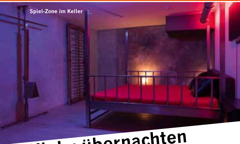
Spiel-Zone im Keller