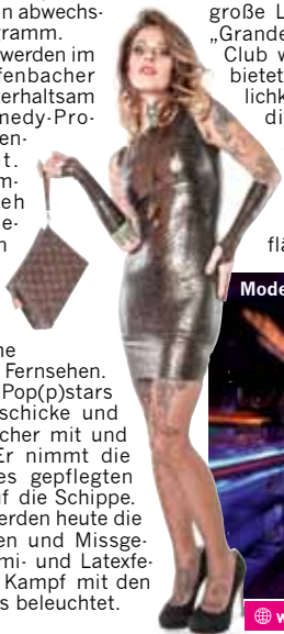
Mode und Heavy Look von Rubberik

Am Samstag ist es dann der Fotograf „Matthias Wallmeier“, der die Gäste in ihren tollsten Outfits in Szene setzt und für das Tagesprogramm sorgt. Er weiß, die Personen im Einklang mit dem Material zu inszenieren. Die große Latextrem-Party steigt in der „Grande Opera“ in Offenbach. Der Club wurde immens erweitert und bietet heute eine Vielzahl an Möglichkeiten. Der Host der Nacht wird die bezaubernde Latex-Lady „Amarantha LaBlanche“ sein. Musikalisch untermauert wird das Spektakel von DJ Mario, der mit seinem abwechslungsreichen Sound die Tanzfläche zum Kochen bringt. ■